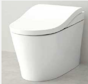
ウォシュレット一体型便器ネオレストLS1 品番：CES9810M、 希望小売価格：¥448,000（税別）