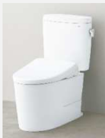
ピュアレストEX 品番：CS400BM+SH400BMA 希望小売価格：¥144,000（税別） ウォシュレットアプリコットF1 品番：TCF4714、 希望小売価格：¥123,000（税別）